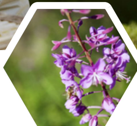
■ Horsma, kesän viimeisiä kukkijoita.