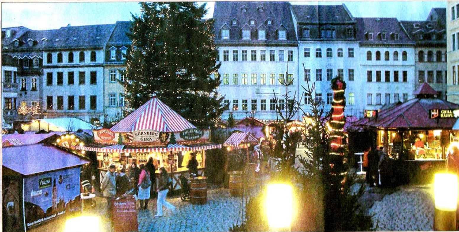
Geras Märchenmarkt lädt auch dieses Jahr wieder in der Adventszeit die Besucher ein. Anlässlich des „Mitternachts-Shoppings“ am Freitag, dem 18. Dezember, kann man in der Innenstadt sogar bis 24 Uhr flanieren und einkaufen.